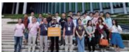
上海建筑设计研究院有限公司