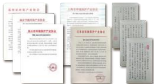
行业机构支持函文件

主办方整合行业资源，多年来一直与全国环保产业协会、地方水务公司及终端行业协会保持着紧密的合作。本届展会，主办方将拓宽资源渠道，联合全国环保产业协会及相关协会机构，集结上海、北京、广东、浙江、江苏、深圳、山东、湖南、湖北、陕西、江西、重庆等环保及相关领域供应商和用户齐聚上海，围绕工业环保及市政等领域，分享技术及解决方案！