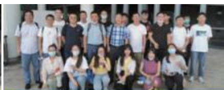
宁波市建筑设计研究院有限公司