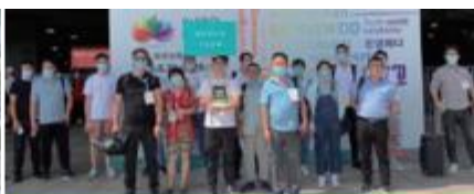
湖州市环保产业协会